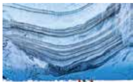
南極での調査風景