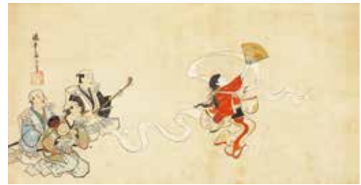
重要文化財 布晒舞図 英一蝶 一幅 江戸時代 17~18世紀 遠山記念館 【展示期間: 10/16~11/10】